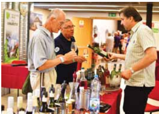
Litoměřický hrozen čeká 10. ročník. Znovu ho navštíví vinaři z celého Česka.

Hrad je v sobotu 4. června otevřen všem mi-