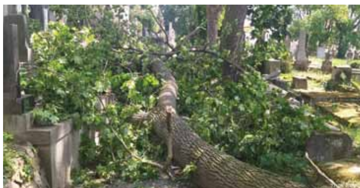
Obrovský nápor větru porazil i silné stromy.

„Město jako pronajímatel hrobových míst je proti odpovědnosti za zdravotní či majetkovou újmu samozřejmě pojištěno, nicméně toto byl zásah „vyšší moci“, který jsme nemohli ovlivnit. Odškodnění