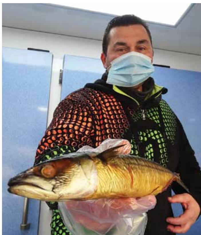
Farmářské trhy probíhají každé páteční odpoledne na tržnici. Koupíte zde i čerstvé ryby.