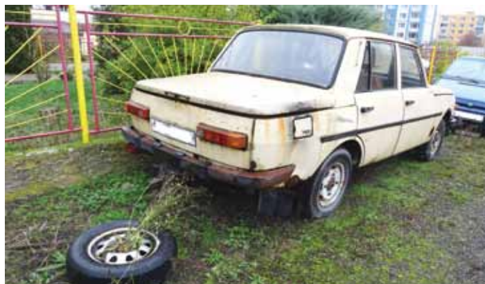
Za mateřskou školou v Mládežnické ulici je vraků hyzdících prostředí hned několik.

Odtah vraků bude řešen dle zákona o odpadech. Podle něj lze vozidlo odtáhnout neprodleně. „Takto přísně ale postupovat nechceme. Nejprve vlastníka vyzveme, aby do čtrnácti dnů auto ekologicky zlikvidoval a tento krok doložil. Teprve pokud tak