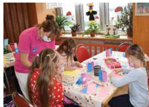
Dopoledne se děti učí, odpoledne si hrají a tvoří.

„Pro potřeby online vzdělávání byl pro děti připraven počítač s internetovým připojením. Ti, kteří měli vlastní notebooky, využívali svá zařízení pro účely vzdělávání rovněž připojená na nemocniční Wi-Fi síť. Pro žáky zapojené do online vzdělávání byly navíc k dispozici samostatné pokoje, kde měli na výuku potřebný klid. Samozřejmě i zde