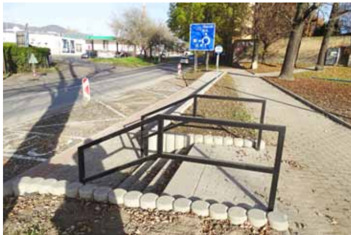
Součástí oprav bylo i vybudování nových autobusových zastávek v obou směrech.

Realizace projektu si vyžádala 3,9 milionu korun. „Z čehož 2,9 milionu korun pokryla dotace ze Státního fondu dopravní infrastruktury, zbytek doplatilo město,“ sdělila Dana Svobodová, vedoucí oddělení veřejných zakázek a