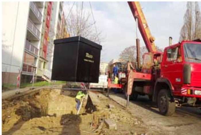
Podzemní kontejnery byly instalovány ve druhé polovině listopadu v ulici Alfonse Muchy.

Budovat ve městě nádoby na odpad zapaštěné do země má několik důvodů. „Nyní jsou podzemní nebo polopodzemní kontejnery trendem. Instalujeme je hlavně kvůli jejich objemu, který nezabere místo na chodníku, působí i více esteticky a měly by být odolnější vůči vandalismu. Dalšími výhodami jsou eliminace zápachu nebo zabránění jejich vybírání,“ vyjmenovala Kristýna Slabochová, referentka správy odpadového hospodářství MěÚ.