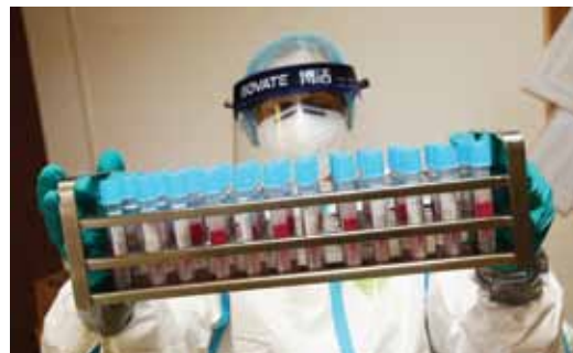
Odebrané vzorky jsou odesílány do laboratoří, s nimiž nemocnice spolupracuje. Nyní se připravuje na to, aby tak mohla činnit sama.

Odběrové místo, které přijímá pacienty indikované pro odběr buď Krajskou hygienickou