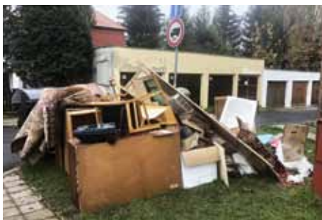
Přímo na veřejném prostranství. Stav z ulice Spojovací, kde se viníka podařilo vypátrat.

V ulici Spojovací se viníka podařilo odhalit. „Byl vyzván, aby nepořádek odklidil a za své jednání ponese následky,“ sdělila Kristýna Slabochová, referentka odboru životního prostředí MěÚ. K obdobné situaci došlo v posledních dnech i v ulici Družstevní. Zde se bohužel viníka vypátrat