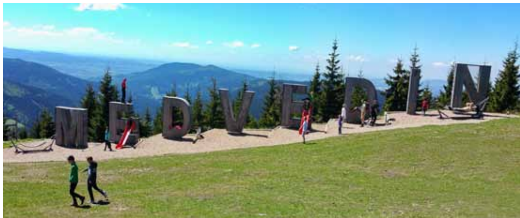
Fotopoint může mít různé podoby, v každém případě by však měl respektovat své okolí. Ve tvaru písmenek se s ním setkávají turisté, kteří zavítají na Medvědin.

Příspěvky je možno zasílat na e-mail: zpravodaj@litomerice.cz. Uzávěrka 15. dne měsíce předcházejícího vydání. Redakční rada si vyhrazuje právo příspěvky krátit a po stylistické stránce upravovat. Autoři nesou odpovědnost za obsah svého příspěvku.