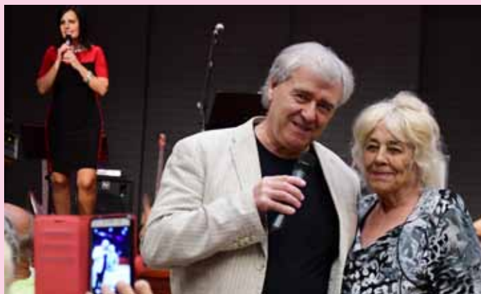
Společná fotografie se zpěvákem oblíbeného dua Eva a Vašek byla vítaným zpestřením odpoledne.

Kampaň se každoročně těší velké oblibě. Kartu a informační brožurku si letos vyzvedlo 160 seniorů. „Takový zájem nás velmi těší. Do kampaně se zapojují čím dál starší lidé. Více než 20 % bylo nad 80