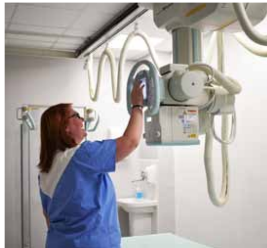
terstva zdravotnictví ČR povolení na konci února letošního roku. Text a foto Naďa Křečková

Hodnota veřejné zakázky na dodání nového skiagrafického kompletu, která zahrnovala i dodání pojízdného rentgenu s digitalizací, přesáhla šest milionů korun. Instalací nového skiagrafického kompletu byla dokončena modernizace radiologického pracoviště. V plánu je však ještě obnova nové angiografické linky, pro kterou získala nemocnice od přístrojové komise Minis-