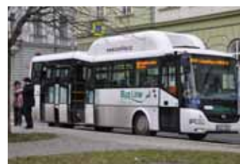
Společnost TD BUS s velkými problémy skončila. Nejen Litoměřice, ale i okolní města a kraj dostala do potíží s autobusovou dopravou.

Kapacitní a technické důvody novému dopravci v současné době neumožňují zajistit provoz v takovém rozsahu, jako tomu bylo dříve, a proto dochází k omezení provozu části spojů na obou linkách. Jde o některé brzké autobusové spoje po čtvrté hodině ranní a takové, u nichž by bylo třeba více řidičů na jedné lince najednou. Dále pak večerní spoje po osmnácté hodině. Stav se má průběžně zlepšit s postupným navyšováním počtu řidičů.