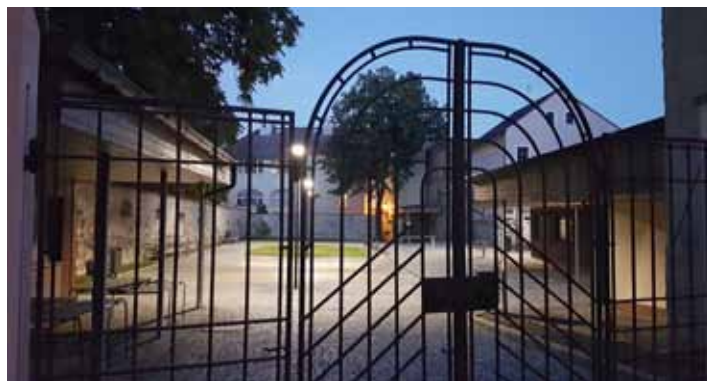
Letošní první farmářské trhy se uskuteční v pátek 26. dubna v prostoru nově zrekonstruované tržnice.

„Chceme jít po vzoru měst jako Roudnice nad Labem, Ústěk, Česká Lípa, kde farmářské trhy mají již svou tradici. Libor Uhlík je pro radní města člověkem, který by měl pomoci tuto tradici nastartovat. Má