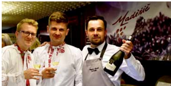
Nejlepší česká a moravská vína, perfektní nálada a skvělá cimbálková. To jsou Vinařské Litoměřice.

Návštěvníci budou moci i tentokrát ochutnat nejlepší vína, která sklídila úspěch v soutěži, jež akci předcházela. Na 100 degustátorů hodnotilo na konci března v hotelu Koliba celkem 758 vzorků do soutěže přihlášených vín, a to od 126 vinařství a vinařů ze 12 evropských zemí. Předsedové hodnotitelských komisí ve finále mezi devíti víny vyhodnotili a udělili titul Champion vín ČR Rulandskému šedému, výběr