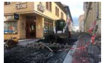
Stav prací na konci března. Hotovo bude do konce dubna.

Stavební úpravy části ulice Vavřínecké byly dokončeny. V současné chvíli probíhá dláždění chodníku na křižovatce s Dlouhou ulicí. Práce budou dále pokračovat k části napojení do Dominikánské ulice. Ve Vavřínecké ulici byly upraveny povrchy v celé šíři komunikace, včetně nových bezbariérových chodníků a vytvoření nového koridoru s povrchem z hladkých žulových desek pro cyklisty. Termín dokončení rekonstrukce je stanoven na 30. dubna. Investice si vyžádá náklady města ve výši 4,3 milionu korun. (pek)