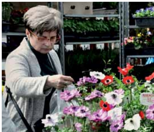
Jarní tržnice je vždy pastvou pro oči, které potěší rozkvetlé květiny.

Výstavy Tržnice a Bydlení odstartují jarní sezónu na Zahradě Čech. Návštěvníci mohou vystavěti