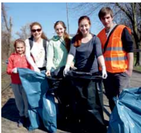
Loni se do úklidu zapojila hned celá řada dobrovolníků.

„I letos chceme s partnery a aktivními občany uklidit nelegálně vzniklé černé skládky a nepořádek v různých částech Litoměřic. Kdo chce akci podpořit individuálně, postačí, když uklidí nepořádek ve svém okolí. Každý se však může připojit i k uklízací skupině, která se sejde v sobotu 6. dubna v 9 hodin na zastávce Českých drah Litoměřice-Cihelna,“ vysvětlila Irena Vodičková, koordinátorka Zdravého města Litoměřice. V případě dotazů a požadavků na pytle a rukavice ji můžete kontaktovat na tel.č. 416 916 400 či mailem na irena.vodickova@litomerice.cz. Technické