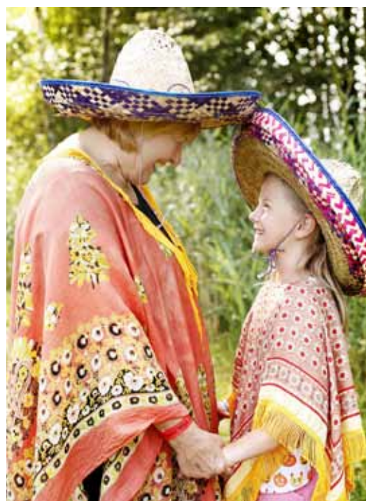
Společné chvíle jsou k nezaplacení.

Chcete prožít nezapomenutelné chvíle na bezva táboře se svými dětmi? Více informací se dozvíte na stránce www.bezvaparta.com . Adéla Marková