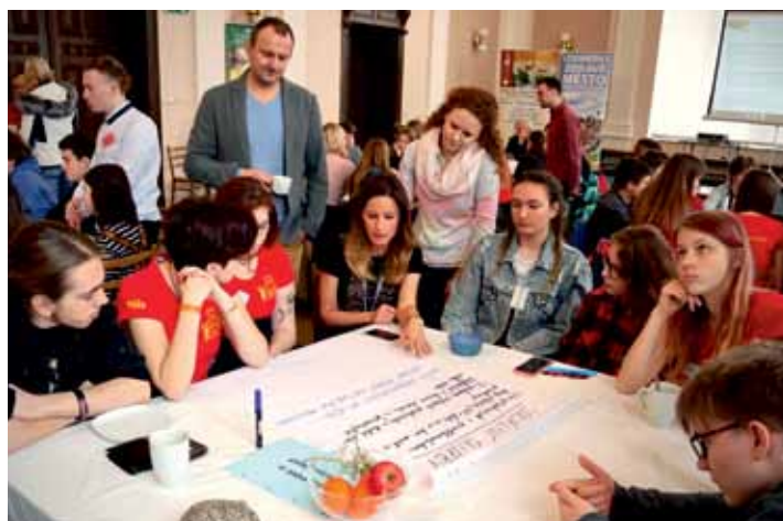
Žáci a studenti litoměřických škol diskutovali takto problémy města již podávat.

Nápad uspořádat přednášku o sexu získal bezkonkurenčně nejvyšší počet hlasů, zvítězil se 20 body, druhé místo (LGBT) obdrželo 8 hlasů. Třetí příčku se sedmi body obsadil návrh na zřízení tělocvičny u ZŠ Masarykova. Mezi dalšími návrhy bylo například zavedení kontrol policie v klubech či kvalitní stravování v Centrální školní jídelně. Do desítky nápadů postoupilo také zprovoznění