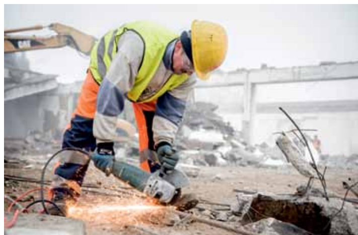
Bourací práce probíhaly v lednu za každého počasí.