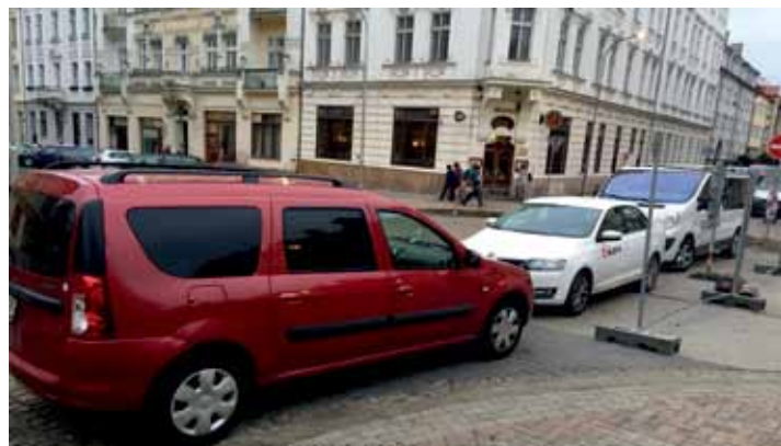
Fotografii dokumentující situaci, kdy vozidla parkují v místech, kde komplikují provoz, zaslal redakci zpravodaje nespokojený obyvatel této lokality.

rekonstrukce ulice postupují podle harmonogramu. „Jedním z hlavních cílů probíhající druhé etapy je zhotovení chodníků k ulici Křížkova k novému přechodu u horního vlakového nádraží. V Křížkově ulici dojde k výsadbě nového stromořadí, přibudou květníky, rekonstrukce se dočká i veřejné osvětlení,“ sdělila vedoucí odboru