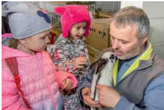
Výstava chovatelů se loni těšila velkému zájmu veřejnosti, obzvláště dětí.

Součástí výstavy je propagační expozice okrasného ptactva, kožešinových zvířat, koček, akvarijních rybiček, terarijních zvířat. Dále výstava králíků, drůbeže a holubů s mezinárodní účastí spojená se soutěžní výstavou chovných králíků - samců. Ve venkovních prostorách návštěvníci uvidí koně, ovce, kozy, ukázky dravců. Pro děti organizátoři nachystají různé soutěže, hry, hudební a divadelní program aj. Nebude chybět králíčí hop (skákání králíků přes překážky), možnost projížďky na koních a včelařský koutek. Program zpestří ukázka práce záchranářských psů, ukázka preparovaných zvířat, psí agility a dogdancing (tančící psi). Dále budou k vidění carving (dekorativní úprava ovoce, zeleniny) a fresh nápoje. V sobotu 10. 2. proběhne klubová výstava teddy králíků, ušlechtilých morčat a 1. Severočeská výstava ježků.