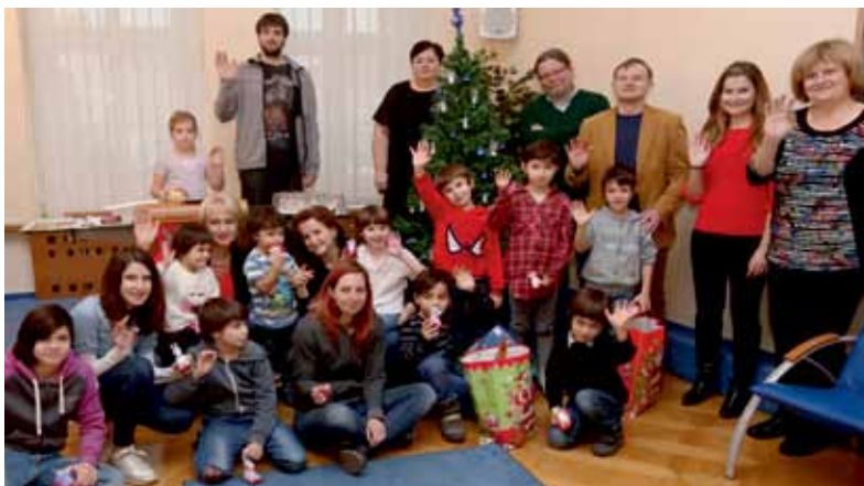
Děti z Klokánku u vánočního stromku v obřadní síni města.