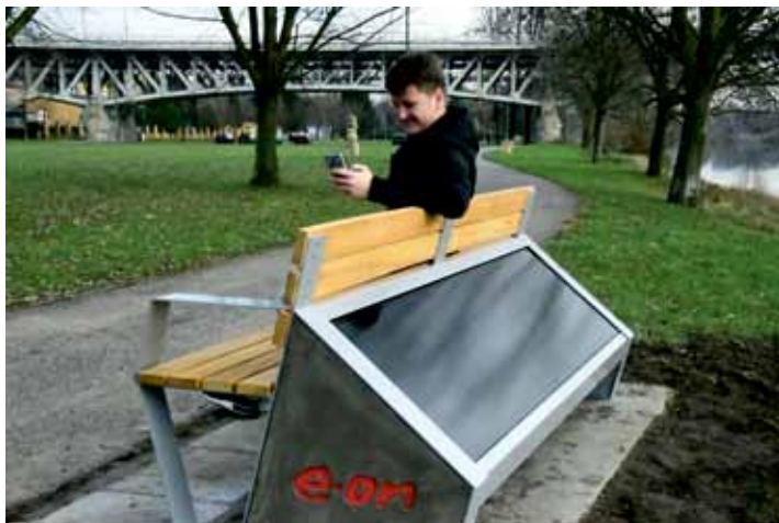
Druhá solární lavička je na Střeleckém ostrově u Labe.

Lavička dobíjí mobilní zařízení přes USB porty a nově také bezdrátově přes indukční dobíjení. Stejně tak poskytuje Wi-Fi připojení k internetu. Důležitá je její schopnost zaznamenat počet připojení, což poskytne zpětnou vazbu o využití. Náklady na pořízení a instalaci dosáhly 113 tisíc korun (bez DPH), avšak společnost E.ON, organizátor kampaně usilujících o instalaci solárních laviček, uhradila městu 75 procent nákladů.