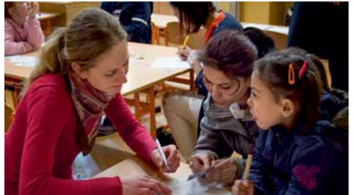
Loni dorazily k zápisu více než tři stovky budoucích prvňáčků. V Základní škole v Havlíčkově ulici.

Kontrolou dále bylo zjištěno, že některé ulice nejsou ve stávající vyhlášce uvedeny. Šlo o ulice Dubová, Jarní, Jiráskovy sady, Mentaurov, Mezibraní, Mostná hora, Písečný ostrov, Střelecký ostrov a Veveří. Na seznam proto byly doplněny a přiřazeny k nejbližší spádové škole.