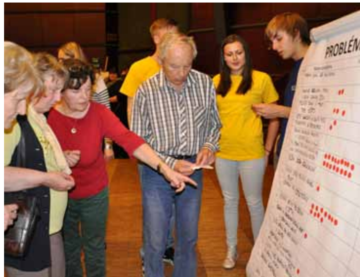
Účastníci diskuse také měli možnost rozhodnout, kdo tentokrát získá od města příspěvek ve výši 10 tisíc korun. Nejvíce hlasů získal Hospic sv. Štěpána.