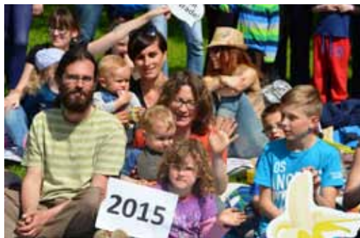
Účastníci férové snídaně.

V Jiráskových sadech se v sobotu 9. května sešlo kolem 70 lidí na pikniku Férová snídaně. Podpořili tak fairtradové a lokální pěstitele. Litoměřičané tím dali jasně najevo, že je zajímavá, kdo a za jakých podmínek pro ně pěstuje například čaj, kávu nebo zeleninu a ovoce. Piknik proběhl na Světový den pro fair trade. V celé ČR snídalo 5 200 lidí na 137 místech.