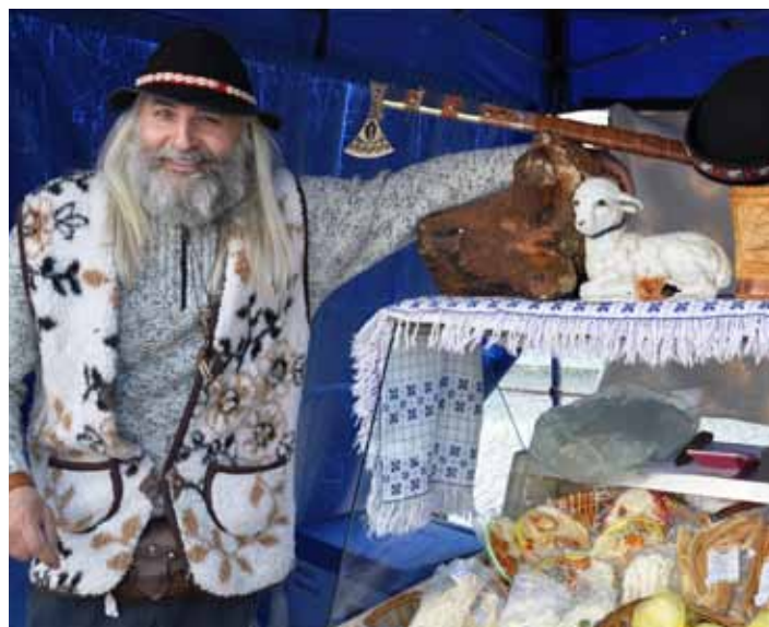
Stylově se na první farmářské trhy oblékl prodejce rozmanitých sýrových pochoutek, který se netajil svým původem z Oravy.