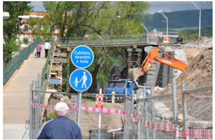
Cyklista, sesedni z kola. Provizorní lávka, vybudovaná s cílem umožnit chodcům, maminám s kočárky a handicapovaným lidem přechod právě rekonstruovaného Tyršova mostu, není určena cyklistům. K instalaci značek došlo s ohledem na nedisciplinovanost některých z nich, vlivem čehož došlo i k několika zraněním.

Semaforey instalované na dvou místech v ulici Na Valech, jež zajišťují roli hlavního průjezdního úseku městem pro dálkovou dopravu, se osvědčily. Umožňují plynulý a bezpečný přechod chodců přes frekventovanou silnici a napojení vozů příjíždějících do ulice Na Valech z ulic Sovova a Osvobození. „Došlo k úpravě časových intervalů a plánů na semaforech tak, aby byl výrazněji upřednostněn provoz vozidel Na Valech na úkor chodců a vozů napojujících se z vedlejších ulic,“ dodal vedoucí odboru dopravy a silničního hospodářství Jan Jakub. (eva)