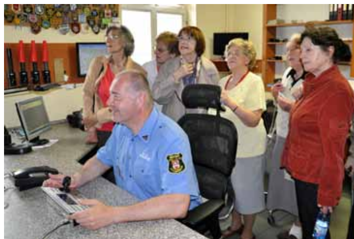
Strážníci seniorům ukázali, jak funguje městský kamerový systém, a poté i předvedli pomůcky, které při své práci používají.

Téměř dvě desítky akcí určených seniorům starším 60 let probíhaly v rámci 3. ročníku kampaně od 27. dubna do 2. června. (eva)