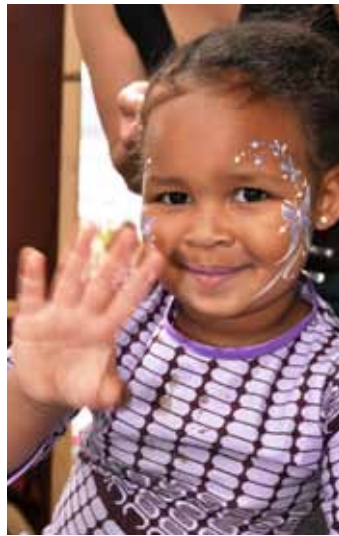
Jedna z nejmladších účastnic loňského 1. ročníku.

Africké tržiště se otevře ve 13.30 hodin, kdy začíná i doprovodný kulturní program. „Chybět nebude módní přehlídka z Tanzanie, hudební vystoupení, několik výtvarných workshopů, čtení pro děti, malování na obličej nebo živá zvířátka. Občerstvení na vás čeká fairtradové a většinou s nádechem Afriky. Opět můžete akci podpořit tím, že přinesete kolo, které již nepotřebujete. Následně bude zas-