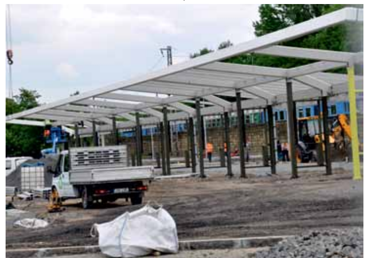
Na snímku vidíme základy ocelové konstrukce přístřešku nového autobusového nádraží.

Poslední fáze, kdy již bude v plném provozu nové autobusové nádraží, zahrnuje stavbu parkoviště pro zhruba osm desítek aut a chodníků podél parkoviště u Penny marketu, včetně dobudování infrastruktury. Provoz autobusů už v té době bude veden po nové komunikaci do ulice Marie Pomocné. Dokončení celého díla je plánováno na září. (eva)