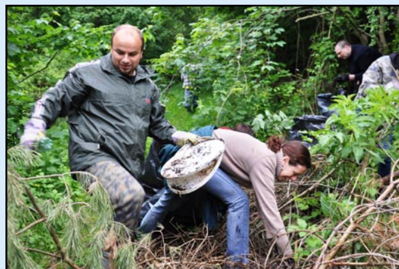
Skupinu, která odstranila černou skládkou za garážemi u hřbitova, tvořili zaměstnanci a uživatelé služeb Naděje.