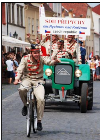
Slavnostního průvodu se účastní hasiči z celých Čech, mnozí v historických uniformách i s historickými vozy.