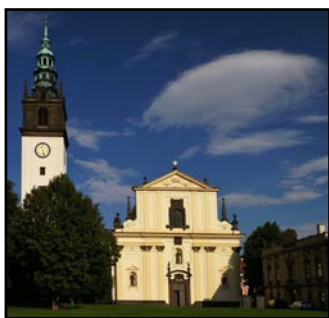
Katedrála sv. Štěpána a sousední věž jsou jednou z dominant nejen Dómského náměstí, ale celého historického jádra města.