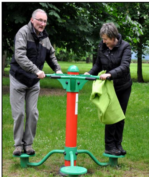
Na Střeleckém ostrově byly instalovány nové prvky. Ty u Labe jsou určeny k aktivnímu trávení volného času příslušníků naší starší generace (foto vlevo), dětské hřiště pro nejmenší se nachází u hospůdky U Letního kina.

„Na nákup dětských herních prvků jsme z rozpočtu města vyčlenili 220 tisíc korun. Prvky pro seniory stály zhruba 100 tisíc korun, přičemž na jejich pořízení jsme získali dotaci ve výši 70 tisíc korun,“ poukázal na finanční stránku věci místostarosta Litoměřic Karel Krejza. (eva)