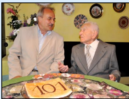
Starosta Chlupáč obdivoval vitalitu oslavence. Ten na oplátku jako skutečný pamětník poděkoval starostovi za to, jak dynamickým rozvojem město pod jeho vedením prochází.

Asi se není čemu divit. Nikdy nekouřil, vyhýbal se alkoholu, nezdravým jídlům a naopak holdoval sportu. „Ještě dnes jezdím každý den v tempu 20 minut na