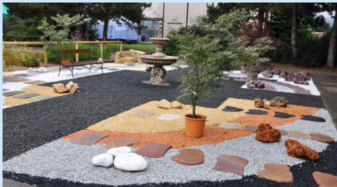
Ukázkové zahrady byly pro mnohé návštěvníky inspirací. Příští rok jich bude víc.

Podzimní prodejní veletrh Zahrada Čech byl pro výstaviště Zahrada Čech prubířským kamenem. Při všeobecném celorepublikovém poklesu zájmu o výstavy a celkovém stavu české ekonomiky můžeme být velmi spokojeni. Výstavy se účastnilo 370 vystavovatelů, z toho 45 prodejců se zahradnickým sortimentem a dále zde bylo zastoupeno 180 prodejců zahradní a lesní techniky, zahradní keramiky, závlah, skleníků i zahradního nábytku. Přestože se snažíme nabídku rozšiřovat, hlavně v oblasti zahradního sortimentu, návštěvníci očekávají i sortiment doplňkový. Výstavu navštívilo 80.000 platících návštěvníků. Největší zájem byl o stromky a keře, sazenice růží i jahod, spokojeni mohli být prodejci s občerstvením.