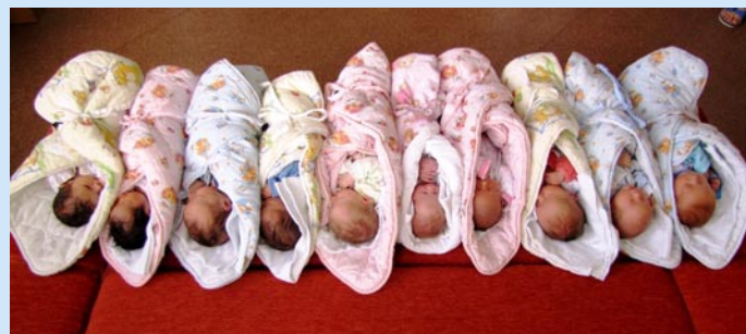
Hned deset miminek se narodilo 20. srpna v litoměřické porodnici. Jde o ojedinělý počet.

Rekordním letošním měsícem v porodnosti byl zatím srpen. Narodilo se zde 81 dětí, z nichž byla troje dvojčátka. Počet srpnových novorozenců je nejen nejvyšším počtem dětí narozených v jednom měsíci od začátku roku 2013, ale zároveň i rekordním ve srovnání s údaji za druhý prázdninový měsíc za minimálně