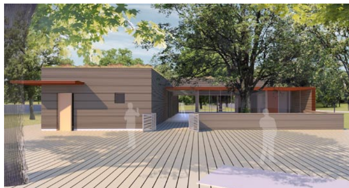
Takto by dle již zpracované studie měla vypadat nová budova dopravního hřiště.

V Jiráskových sadech se uvažuje rovněž o využití originálních informačních prvků inspirovaných návrhy studentů Ateliéru grafického designu a vizuální komunikace z Vysoké školy uměleckoprůmyslové v Praze. Veřejnost by měla mít možnost se s nimi seznámit ještě letos na podzim. Rozsah jejich