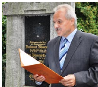
Na památku čestného občana města zavzpomínal u jeho hrobu starosta.

Jeho kořeny sahají do roku 1887, kdy v Litoměřicích dochází k osudovému setkání Blumentritta a Rizala, kteří si do té doby pouze dopisovali. Čtyři společně strávené dny totálně změnily další životy obou mužů. „Blumentritt dostal šanci přeměnit svůj akademický zájem o Filipíny v reálné naplnění a pomoc milované zemi a Rizal našel neoddanějšího přítele, Evropana, který žil pro filipínský národ více než většina samotných Filipínců,“