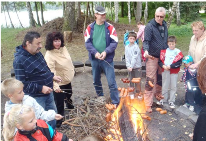
O víkendu nechyběl ani oblíbený táborák spojený s opékáním buřtíků.