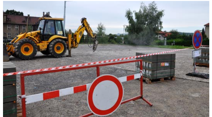
Vždy polovina odstavné plochy před nemocnicí zůstane během rekonstrukce v provozu.

„Již proběhly sondážní práce, které byly před započítáním samotných úprav nezbytné. Poté najela těžká technika, která rozbíjí beton,“ informoval o aktuálním dění předseda Správní rady Městské nemocnice v Litoměřicích