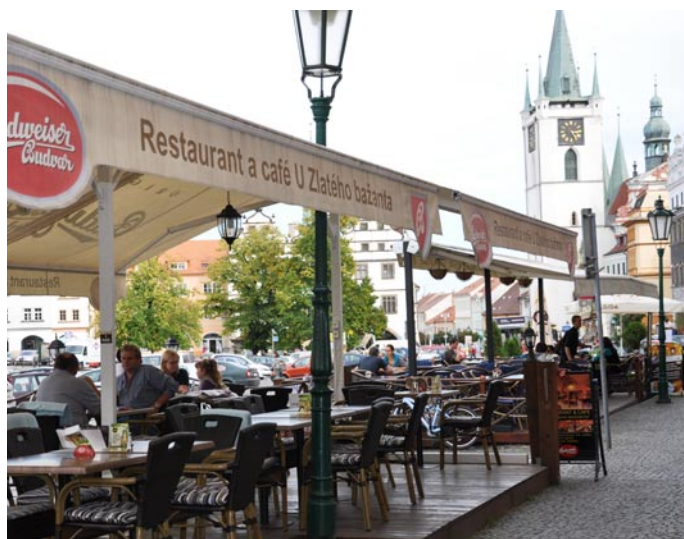
I díky restauracím s předzahrádkami je centrum Litoměřic turisticky atraktivnější.

Radní k nepopulárnímu kroku přistoupili i s ohledem na obyvatele městských bytů nacházejících se na náměstí, z nichž mnozí poukazovali na negativní jevy, jako je hluk z předzahrádek, zápach z kuchyní, zhoršené podmínky k parkování apod. Roky trvající zvýhodnění podnikatelů proto stále častěji kritizovali. Jejich hlasy zesílily poté, co jim město nájemné zvýšilo a živnostníkům nikoliv.