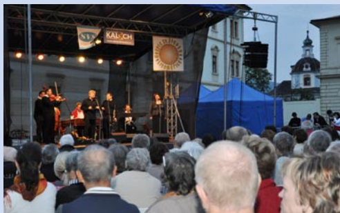
Na Dómské náměstí dorazilo zhruba pět stovek diváků, kteří tak vyjádřili solidaritu s hospicem.

Dómské náměstí v Litoměřicích ožilo 5. září večer hudbou skupiny Hradišťan. Nadační fond Kalich Alexandra Vondry zde totiž pod širým nebem pořádal charitativní koncert, jehož celý výtěžek šel na