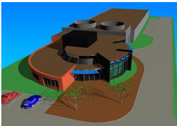
Studie nadzemní budovy teplárny

Co je ale mnohem důležitější, je fakt, že firmy neumí doposud dopředu garantovat úspěšné vytvoření podzemního výměníku. „I proto nejsou schopny a ochotny realizovat podobný projekt tzv. „na klíč“, upozorňuje starosta. Zde prakticky začaly problémy, s kterými se investor, tj. město Litoměřice, potýká dodnes a jejichž vyřešení je podmínkou započítání vrtných prací a dokončení celého projektu. „Konzultační firma, která stála na počátku přípravy projektu, byla