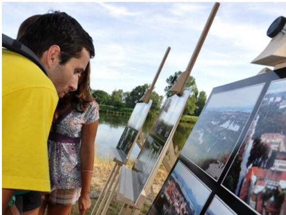
Návštěvníci vernisáže výstavy fotografií Vlastimila Šafránka si přímo u Labe připomněli sílu řádění vodního živlu.

Slova jako hrůza, šílenství a beznaděj zaznívala v sobotu 19. srpna u Labe, v areálu veslařského klubu v Litoměřicích. Centrum cestovního ruchu zde totiž pořádalo vernisáž fotografií Vlastimila Šafránka z povodni roku 2002, tedy deset let poté. Cedule s nápisem Litoměřice stěží vykukuje z laguny, Želetice pod vodou, neprůjezdný Tyršův most, záchranáři mířící na člunu k Terezínu, vyčerpaní dobrovolníci, zatopené Počaply, České Kopisty a další obce v okolí, včetně areálu