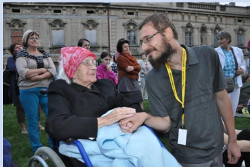
Krásné písně v podání Hradišťanu si zpívali i koncertu přítomní klienti hospice společně s dobrovolníky, kteří v tomto zařízení pracují.

Hospici se rozhodl pomoci i Ústecký kraj, který v září schválil mimořádnou půlmilionovou dotaci. Stalo se tak i zásluhou krajského a zároveň litoměřického zastupitele Hassana