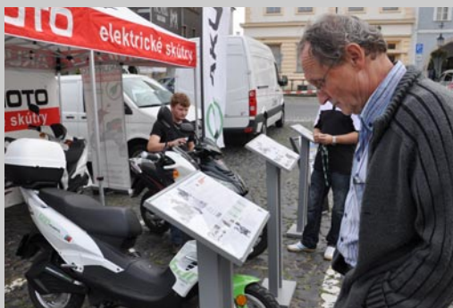
Lidé si se zájmem prohlíželi i elektroskútry.

Akci pořádalo Zdravé město Litoměřice společně s partnery. „Cílem bylo upozornit na narůstající negativní vliv automobilové dopravy, zhoršující se stav životního prostředí, ukázat mož-