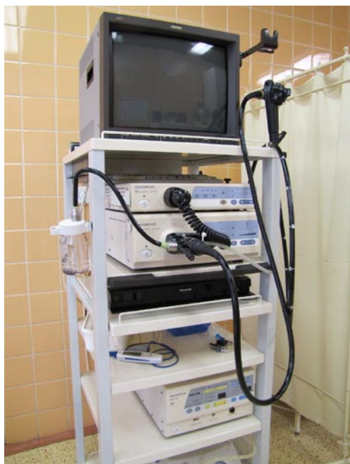
V letošním roce pořídila nemocnice na gastroenterologické pracoviště dva nové videokolonoskopy.