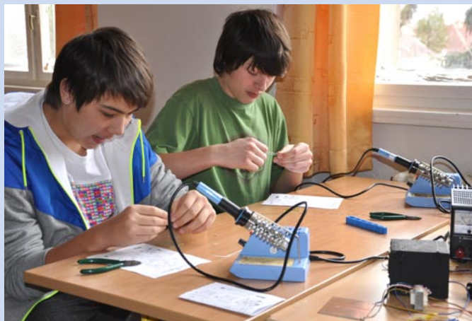
Žáci Masarykovy základní školy si vyzkoušeli kromě jiného i práci s jednoduchými integrovanými obvody.

vě ulici v Litoměřicích, DDM Rozmarýn a městem Litoměřice. Cílem bylo vzbudit u školáků, středoškoláků a veřejnosti vůbec zájem o technické obory. Na humanitně zaměřených školách je totiž převis poptávky nad nabídkou a technicky zaměřené obory mají studentů nedostatek. „Tento nepříznivý poměr pro vědu a techniku bychom rádi zvrátili,“ uvedl Jiří Rudolf, organizátor akce, jehož cílem je s podporou města založit v Litoměřicích technický klub mládeže, který by fungoval při Domu dětí a mládeže Rozmarým. Eva Břeňová