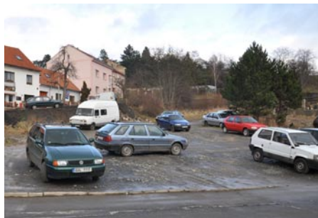
Pohled na místo, kde by v budoucnu mohlo být vybudováno nové parkoviště. Řidiči zde již parkují, ale pozemek není v majetku města, nýbrž státu.

„Již 10. ledna proběhlo společné jednání se zástupci dotčených orgánů, kraje a okolních obcí. Do konce února zpracujeme výsledky projednávání, který předložíme nadřízenému orgánu, jenž rozhodne, zda navrhovaná změna územního plánu není v rozporu s koncepcí územního rozvoje, obsaženou v nadřazených dokumentacích. Předpokládám, že v květnu seznámíme s navrhovanými změnami obyvatelé města prostřednictvím veřejného jednání. V červnu by se jimi mohli zabývat zastupitelé,“ charakterizovala postup vedoucí