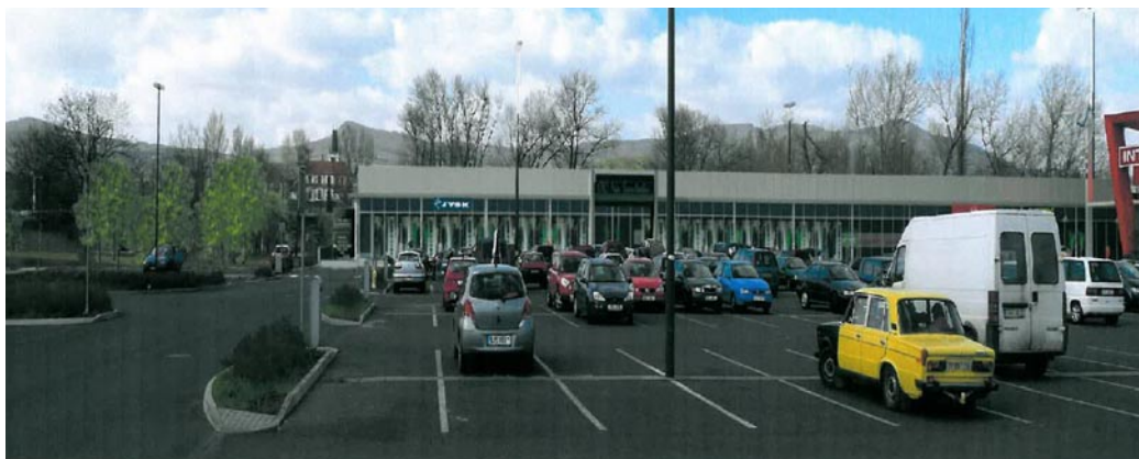
Navržený způsob zástavby u Labe. Z vizualizace je zřejmé, že pohled z parkoviště na město zůstane zachován.

V Litoměřicích plánuje soukromá developerská společnost, jež je vlastníkem pozemků, postavit obchodní centrum v blízkosti Intersparu tak, jak 4. ledna napsal Litoměřický deník v článku nazvaném „U Intersparu postaví další obchodní galerii. Nebude vidět na Labe“. Vedení litoměřické radnice se však v této souvislosti ohrazuje proti tvrzení autora, že nebude vidět na město.