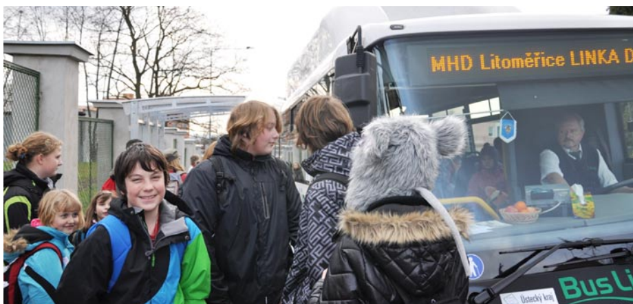
Školákům využívajícím MHD stouplo jízdné o jednu korunu.