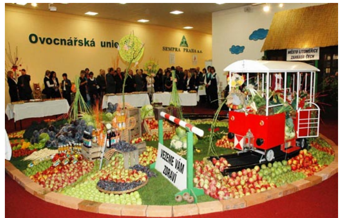
Výstavní pavilony v zájmu zachování jejich konkurenceschopnosti volají po výraznější modernizaci, na kterou město nemá dostatek prostředků. Hledá proto finančně silného partnera.

Rada města se výběrovým řízením již několikrát zabývala. Po