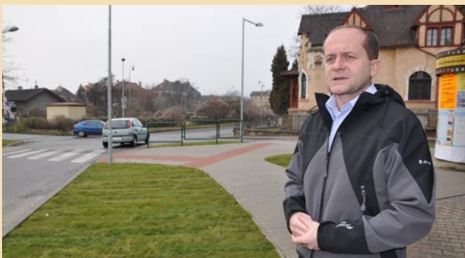
Cílem modernizace křižovatky bylo podle místostarosty Červína zvýšit bezpečí chodců.

V Litoměřicích byla ukončena modernizace křižovatky nad železničním přejezdem, v místě napojení ulic Nerudovy a Sokolovské. Stavbu, zahájenou počátkem listopadu, převzali zástupci města v závěru loňského roku.