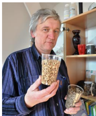
Mikropelety představují levný způsob topení.

„Samozřejmě takové varianty hledáme. Jedním z kroků bude již na jaře čištění komunikací tlakovou vodou, čímž nahradíme klasické zametání, při němž se víří prach. Dále chystáme informační