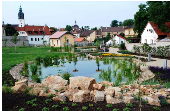
Park U Hvězdárny byl veřejnosti otevřen v červenci roku 2008. Jeho výstavba stála město Litoměřice 19,7 milionu korun.