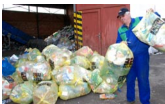
Tříděný odpad je svážen do Prosmyk.

Rozpočet města s navýšením částky na odpadové hospodářství nepočítá. Radní pověřili