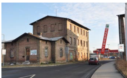
Projektant počítá se zachováním předního domku.