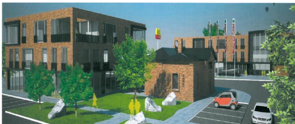
Na vizualizaci vidíme dvě administrativní budovy, jež mají nahradit zchátralé objekty bývalé koželužny.

Litoměřice (dále jen MPR) a jejího prostředí konstatujeme, že navrženým řešením nedojde k negativnímu zásahu do hmotové a kompoziční návaznosti pásma na území MPR, ani k pohledovému narušení siluety MPR, popřípadě míst významných pohledů na MPR a výhledů z ní,“ stojí ve stanovisku ministerstva kultury, jež město Litoměřice obdrželo v závěru loňského roku. (eva)