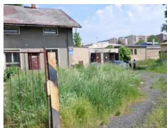
Pozemek i s budovou koupilo město od Českých drah.

„Obyvatelé potřebují sběrový dvůr v dostupné vzdálenosti.