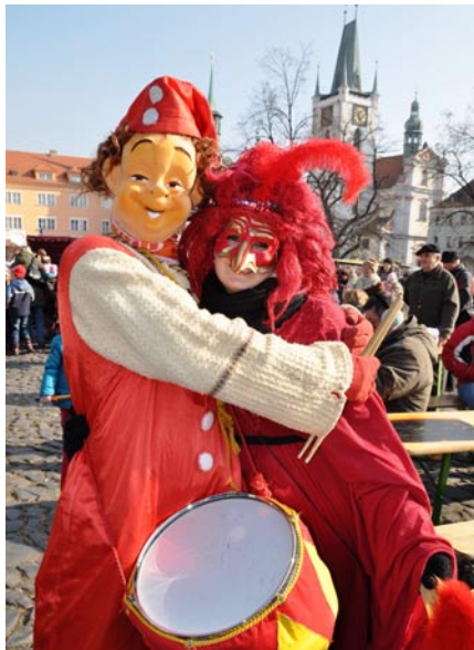
Stejně jako loni projde i letos městem průvod maškar.