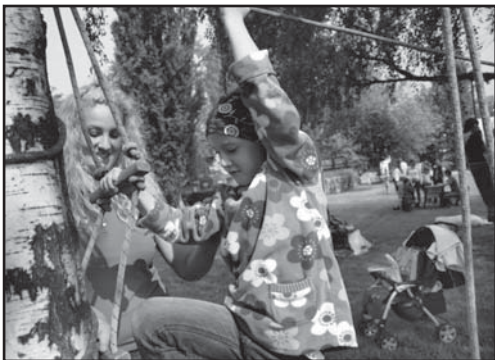
Areál koupaliště byl otevřen u příležitosti oslav Mezinárodního dne dětí.

množství nákladních aut projíždějících centrem. Podle starosty Ladislava Chlupáče dojde v budoucnu i ke snížení intenzity aut vjíždějících do centra ze severní strany. „Je třeba však splnit dvě podmínky. První je opětovné otevření silnice z Litoměřic do Ústí nad Labem přes kopečky. Druhou pak stavba západní komunikace, jež povede dopravu z nového mostu k pokratickým závorám,“ upřesnil starosta. (eva)