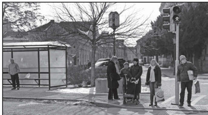
Radní chtějí vědět, kolik by stála instalace semaforů pouze na přechodech pro chodce.

Svůj názor opírá místostarosta o aktuální výsledky monitoringu vozidel, který Na Valech proběhl před několika dny s cílem zjistit, jak se změnila doprava poté, co byl uveden do provozu Most generála Chábery. Průzkum prokázal, že se snížila intenzita vozidel jedoucích z jižní strany města, tedy od kruhové křižovatky Na Kocandě do ulice Na Valech. „Naopak hustota provozu aut jedoucích od kulturního domu,