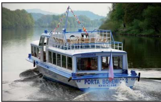
Porta Bohemica 2.

„To, co bylo pouhým experimentem, se mění v dynamicky se rozvíjející tradici,“ ocenil senátor Alexandr Vondra fakt, že zatímco v průběhu první plavební sezóny svezla Porta Bohemica 1 sedmáct tisíc pasažérů, loni jich už bylo třicet tisíc.