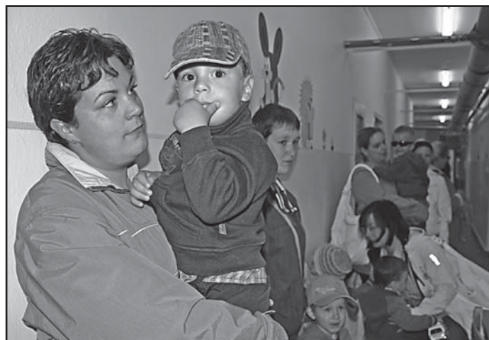
13. května, před osmou hodinou ranní, kdy začaly zápisy, byla chodba mateřinky v Ladově ulici plná rodičů a dětí.

K zápisům se přitom dostavil ve srovnání s loňským rokem téměř shodný počet rodičů. Loni však byla otevřena nová mateřská škola v Ladově ulici s 54 místy a přibyla školní třída v Baarově ulici. Letos sice došlo k rozšíření kapacity v mateřince ve Stránského ulici, ale ani to nestačí. „Do prvních tříd nám