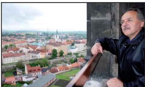
Krásy Litoměřic při pohledu z věže katedrály obdivoval i starosta.

Desítky lidí již pohlédly na město Litoměřice z věže katedrály sv. Štěpána na Dómském náměstí, která byla po sedmi letech opět otevřena veřejnosti. Vystoupat přitom musely zhruba dvě stě schodů.