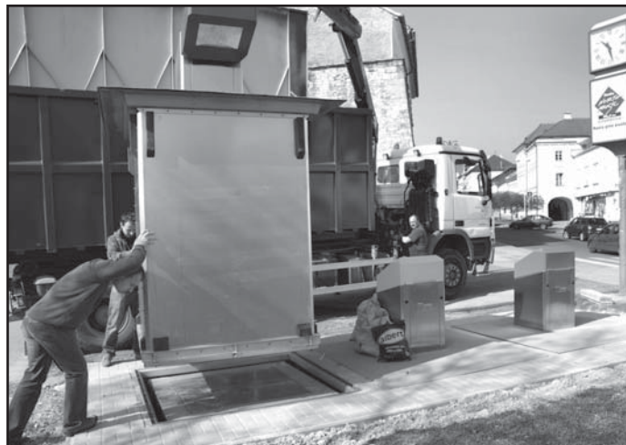
Nové podzemní kontejnery při prvním vývozu. Vedoucí odboru životního prostředí byl mile překvapen kvalitou separace.

Podzemní úložiště odpadu má několik výhod. Vzhledově je oproti klasickému kontejnerovému stání pro turisticky exponovaný střed Litoměřic přijatelnější. Nelze se z něj obzvláště v letních měsících zápach. Další výhodou je snížení četnosti vývozu. A to nejen díky vyššímu množství odpadu, které