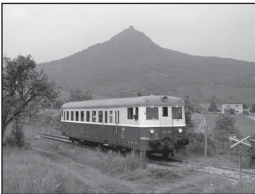
Lokálka jezdící na Švestkové dráze.