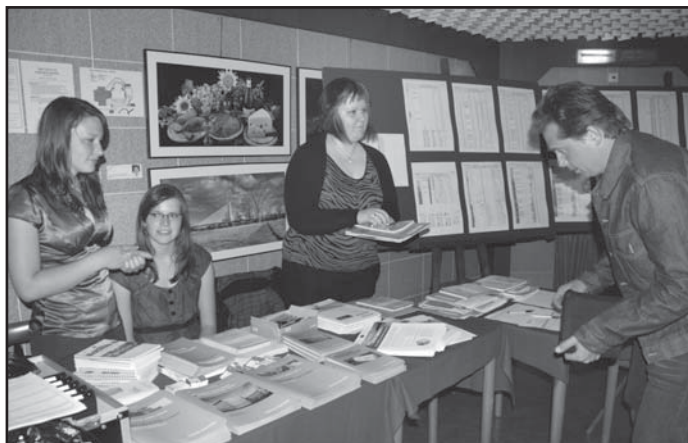
Před vstupem do salonku obdrželi zájemci informační materiály o geotermální energii.

Projekt má řadu výhod. „Kombinací výroby tepla a elektřiny získáte strategický zdroj energie, stabilně dodávané čtyřadvacet hodin denně. A to při minimálním, respektive téměř žádném znečištění životního prostředí,“ uvedl přední