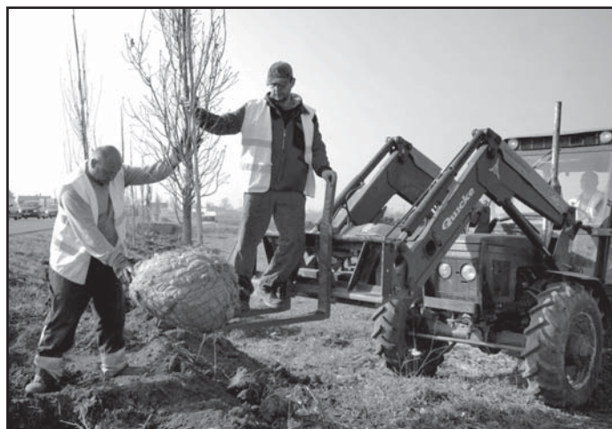
Na katastru Litoměřic bylo vykáčeno 76 topolů. Vysazeno je 129 dubů.

O sazenice se bude po dobu pěti let starat správce silnice. (eva)