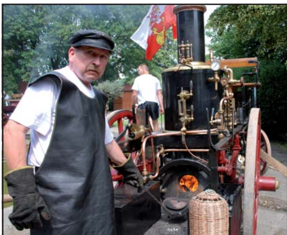
Hasiči na výstavišti Zahradu Čech i letos předvedou historickou techniku.