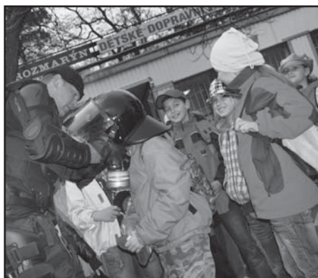
Chlapci si rádi vyzkoušeli přílby policistů a hasičů.

„Zábavně naučnou formou se žáci seznámili s činností policie, záchranné služby a hasičů. Na pískovišti pak děti nacvičovaly chování v rizikových situacích, do kterých by