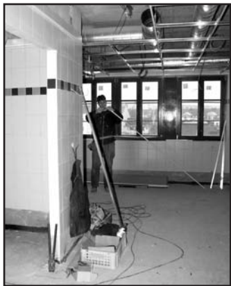
Jeden z právě dokončovaných pokojů s vlastním sociálním zařízením (vlevo) a s již dokončenou vzduchotechnikou.