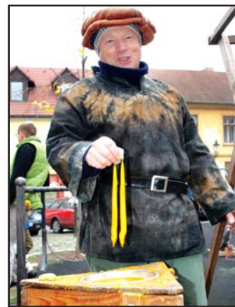
Jeden ze stánkářů nabízel ke koupi svíčky, které na místě sám vyráběl.

Návštěvníci opět naleznou na pultech zhruba třiceti dřevěných stánků voňavé klobásky, medovinu, svíčky, ovocné pečené čaje, ručně vyšíváné dečky, šperky a další ručně vyráběné výrobky a občerstvení. Nebudou chybět ani ukázky starých řemesel.