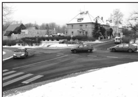
Minikruhová křižovatka přibude i u plaveckého bazénu.