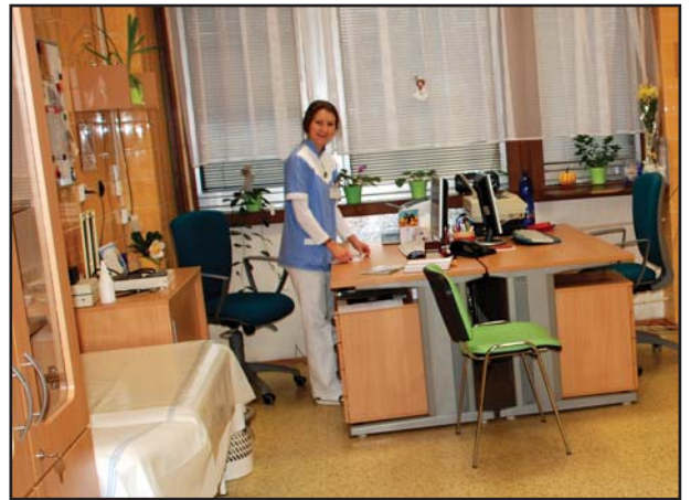
Interiérovými úpravami prošly čekárna a odborné ambulance nacházející se v suterénu nemocnice.

Z akcí realizovaných v závěru loňského roku lze vyjmenovat i opravu vzduchotechniky laboratoří a interiérové úpravy odborných ambulancí. S investicemi do modernizace zařízení a obnovy přístrojového vybavení počítá nemocnice i letos. „Jednou z nejvýznamnějších bude nákup moderního počítačového tomografu (CT) za