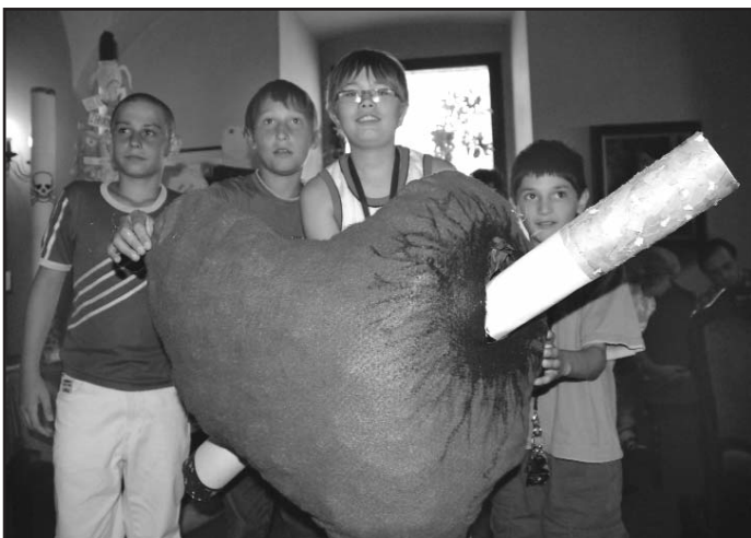
Cigareta jako šíp trčící ze srdce. I takto děti ztvárnily rizikovitost kouření.