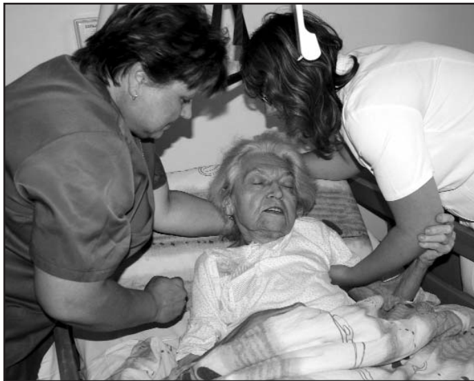
O spokojenost a pohodlí klientů v pěkně vybavených jednolůžkových pokojích s polohovací postelí se stará celkem 47 zaměstnanců.

hospice smělé plány. Praxe totiž ukázala na případy lidí, jejichž vážný zdravotní stav se při pobytu v hospici sice zlepšil, takže pomínily důvody pro další hospitalizaci, ale rodiny se o ně odmítají nebo nemohou samy starat. Přejít do domácího prostředí hospice do LDN přitom lidé odmítají. „Proto bychom rádi uskutečnili přestavbu podkrovní tak, aby zde mohlo být osm lůžek sociální péče, kde bychom těmto klientům nabízeli tzv. odlehčovací služby, částečně hrazené dotací Ministerstvem práce a sociálních věcí. Pokud by se jejich stav zhoršil, přeložili bychom je zpět do prostředí, které důvěrně znají a kde jim bude opět poskytnuta hospicová péče,“ charakterizuje Pavel Česal projekt, jehož realizace vyjde na zhruba pět milionů korun. Polovinu již získal od štědrých dárců. Patří mezi ně i žena, která hospici darovala 1,2 milionu korun utržených z prodeje bytu.