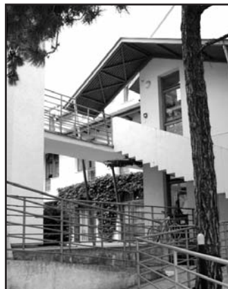
Architektonicky zajímavá budova stojí na Dómském pahorku. Jindy nerušený klid dočasně narušuje stavba domova důchodců, která probíhá v těsném sousedství.

Podpořit hospic můžete zasláním DMS ve tvaru DMS HOSPICSTEPAN na číslo 87777. Cena DMS je 30 Kč, výše Vašeho daru 27 Kč.