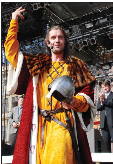
Na vinobraní i letos dorazí král Karel IV. se svou družinou.

Historické tržiště, originální ležení císaře Karla IV., stejně jako ukázky starých řemesel (vše s výkladem) vyplní centrum města nejen v průběhu pátečního odpoledne, ale i celého sobotního dne, kdy program odstartuje v 11 hodin. Na hlavním podiu postupně od 11. hodiny vystoupí kapely Poutníci, Cop, Kamelot a Hop Trop. Dětská scéna tentokrát vyroste na Kostel-