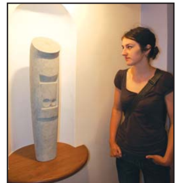
Autorkou figurální plastiky ztvárňující svatou Dorotu, patronku nevěst, je A. Kumstátová z Mířovic.

litoměřické muzeum a kostel. Motívem druhého díla jsou krásné tváře muže a ženy. (eva)