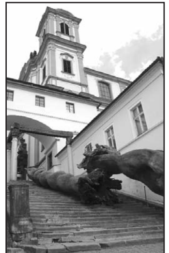
Opravě poničených schodů brání rozměrné dílo.

Autorem díla je akademický sochař Jiří Beránek. Umělec, známý svými díly i ve světě, ho vytvořil na počátku devadesátých let v rámci tehdy probíhajícího sochařského sympozia „Barok a dnešek“. Poté přešlo do majetku Severočeské galerie výtvarného umění v Litoměřicích. (eva)