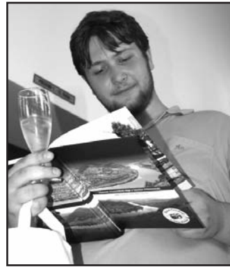
Návštěvníci vernisáže dostali knihu zdarma.

Dílo je o to cennější, že jeho autory jsou školáci, kteří se pod vedením pedagogů zapojili do stejnojmenného projektu, jehož cílem bylo zlepšit vztah mládeže ke svému okolí, nalézt ztracené kořeny v oblasti, které se dříve říkalo Sudety, a to za pomoci počítačových a digitálních technologií. „Děti debatovaly s pamětníky o