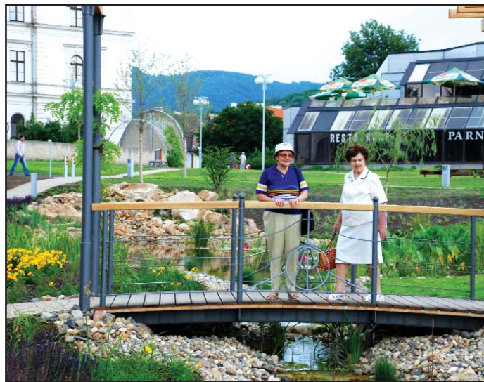
V den otevření si nový park přišlo prohlédnout několik desítek lidí.