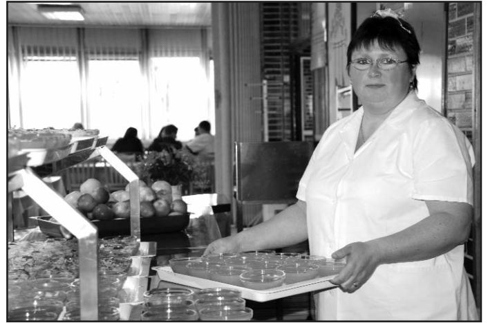
Centrální školní jídelna zajišťuje stravování stovkám školáků.

Na posledním jednání však radní tento záměr pozastavili. Státní dotaci na školní obědy totiž mohou dostávat